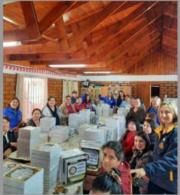
RC San Javier y Satélite San Javier Villa Alegre entrega ayuda a damnificados de Ninhue y Tomé.