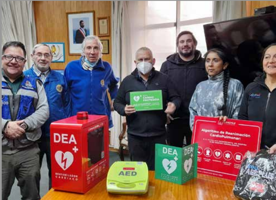
RC Ancud entrega Desfibrilador en conjunto con un Club de USA