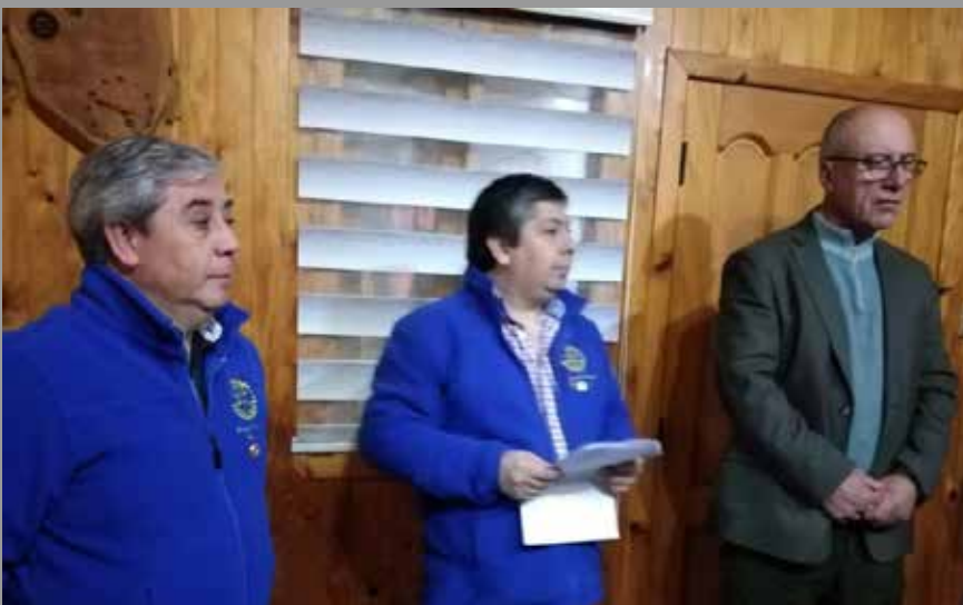
RC Ancud Pudeto Incorpora Nuevo Socio