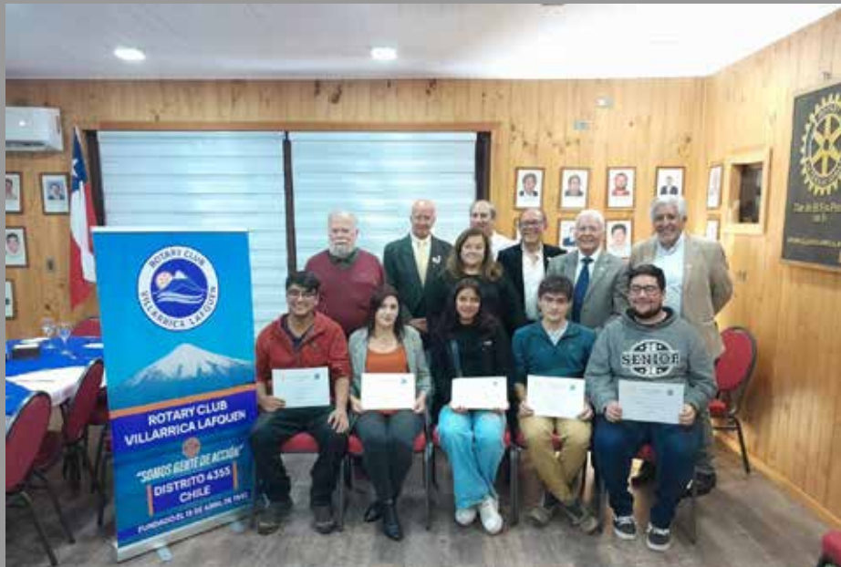
Rc Villarrica Lafquen Entrega Becas A 5 Estudiantes A Educación Superior