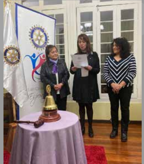
Investidura Nueva Socia RC Angol Esperanza