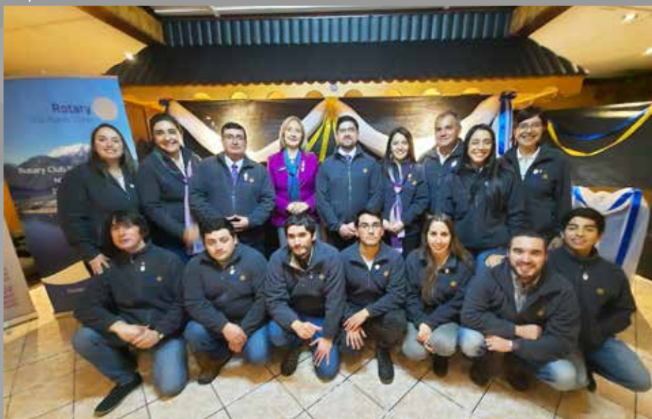
Nuevo Club Rotario RC Puerto Cisnes ¡Bienvenidos!