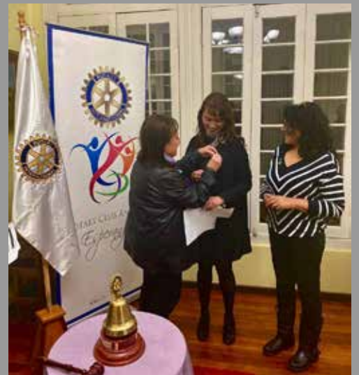
Investidura Nueva Socia RC Angol Esperanza