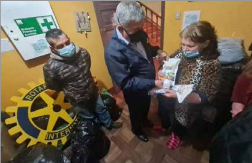
RC Chillán en Operativo Médico-Social