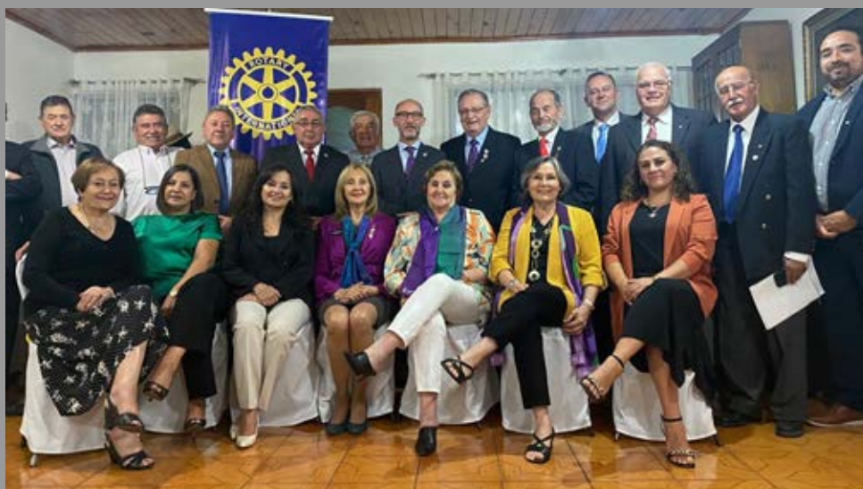
Visita oficial a RC Yungay