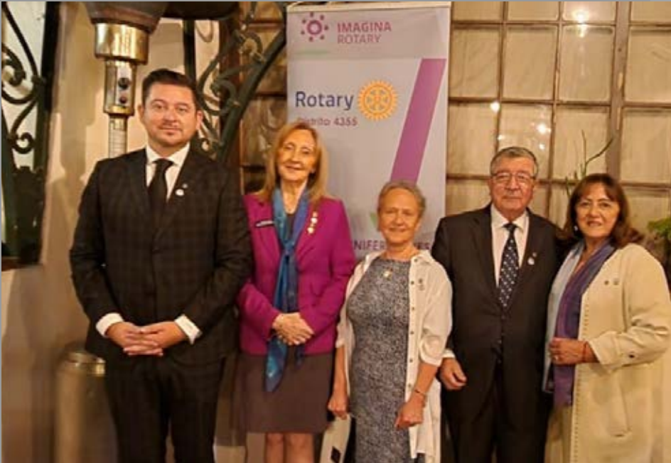
Investidura de nueva socia y socios en RC Linares del Maule