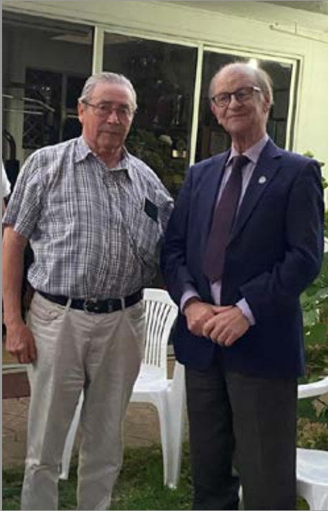
Ingreso de nuevo socio a RC Yumbel