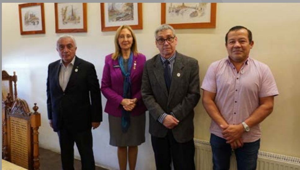
Visita oficial a RC Victoria