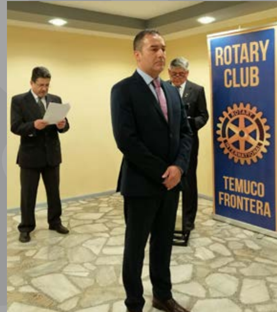
RC Temuco Frontera investidura de socio en aniversario 38