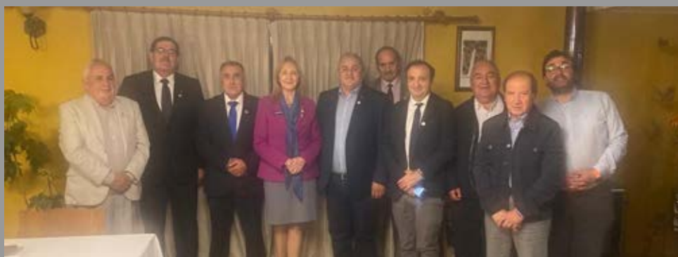
Visita oficial a RC Curacautin