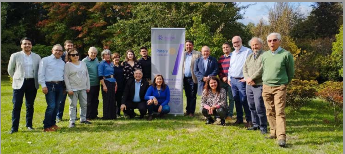
RC Valdivia en sus 96 años