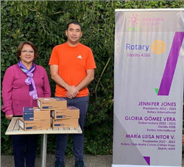
RC Marta Colvin Chillán Viejo entrega equipos de radios a Bomberos