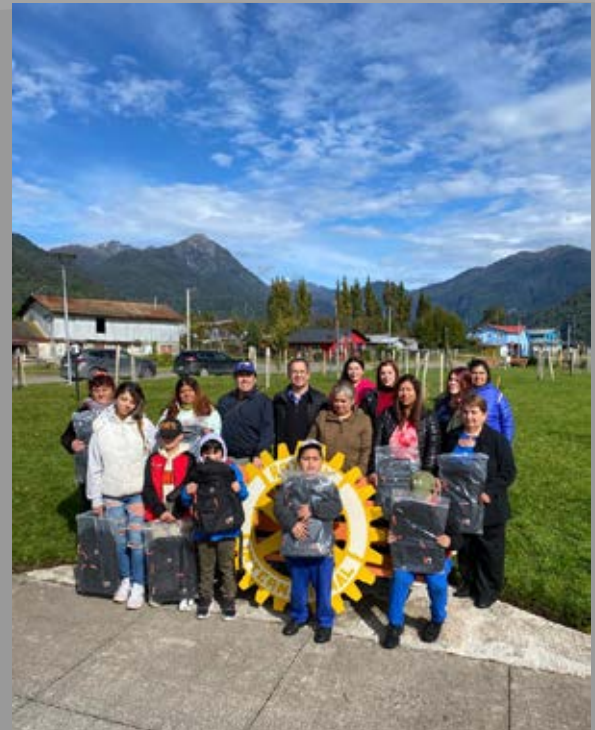
RC Puerto Aysén en acción