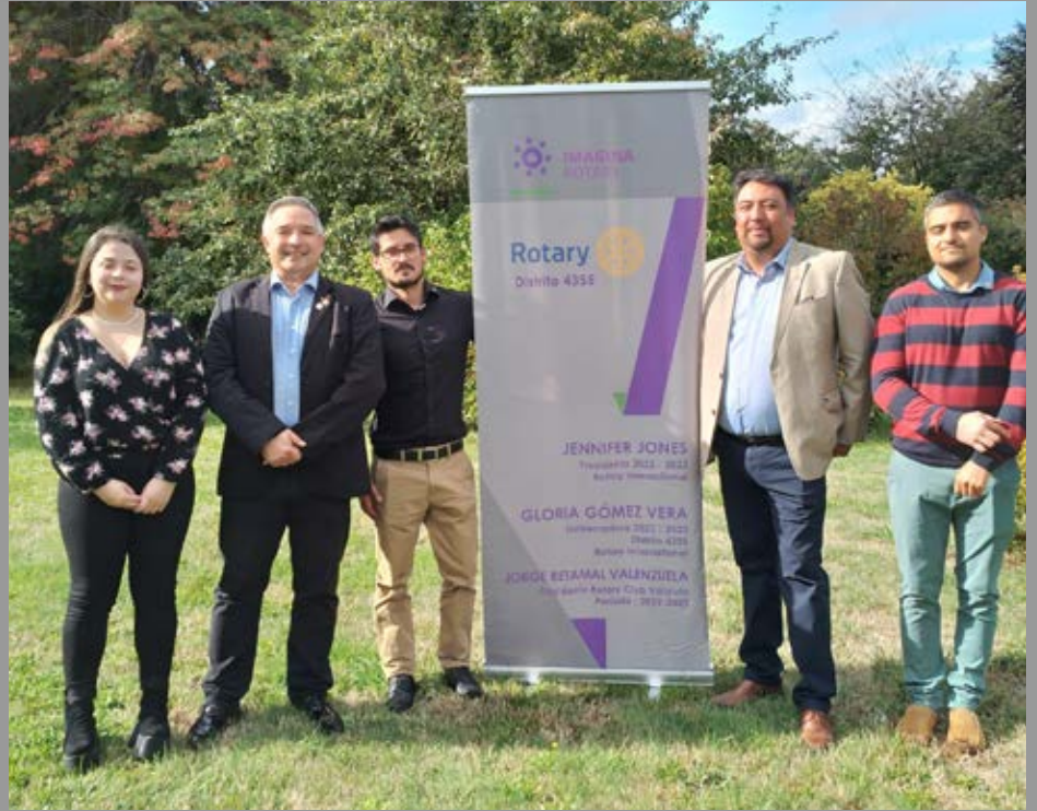
RC Valdivia ingresa nuevos socios