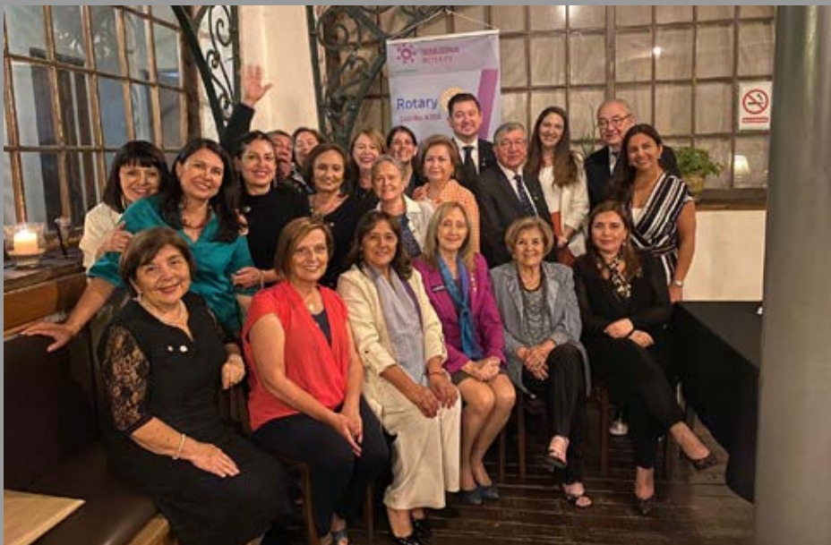
Visita oficial RC Linares del Maule