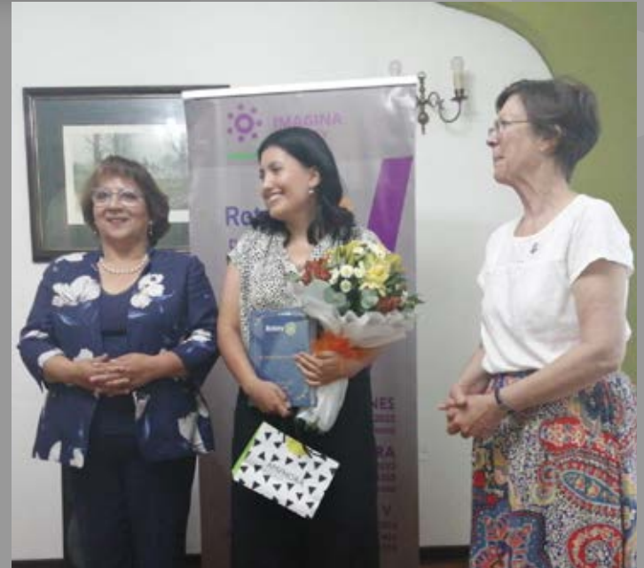
RC Marta Colvin Chillán Viejo, incorpora nueva socia