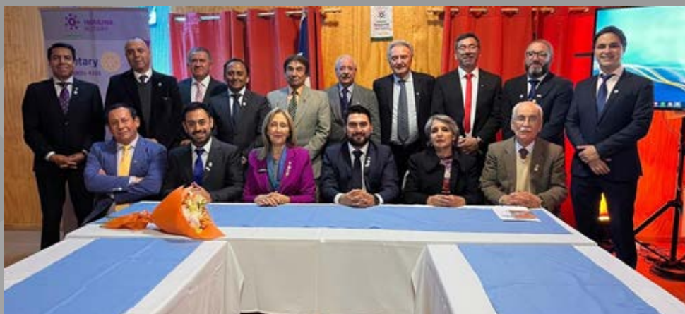
Visita oficial a RC Lautaro