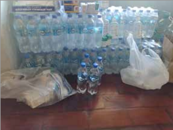
RC Marta Colvin Chillán Viejo.