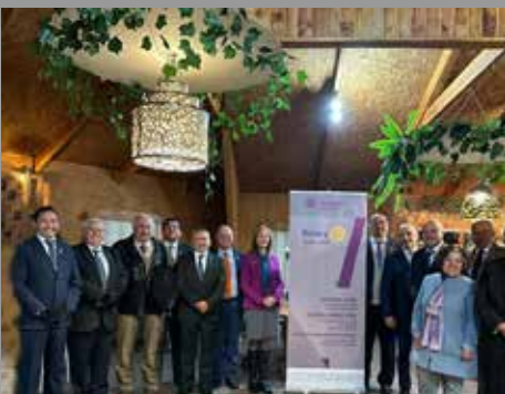
RC Coyhaique y Asistente de GD Zona 20