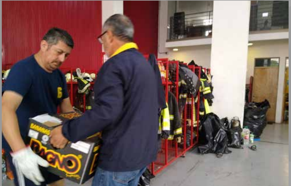
RC Concepción Norte