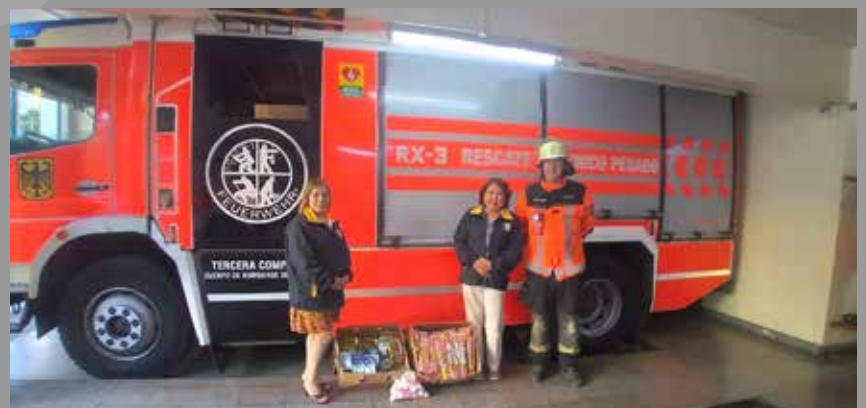
RC Temuco Ñielol