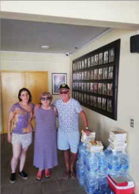
RC Temuco Norte