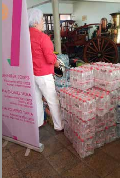
RC Las Águilas Temuco