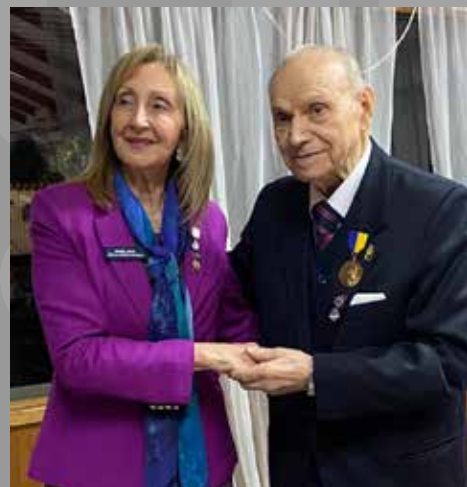
Socio con 55 años de Rotario. RC Yumbel