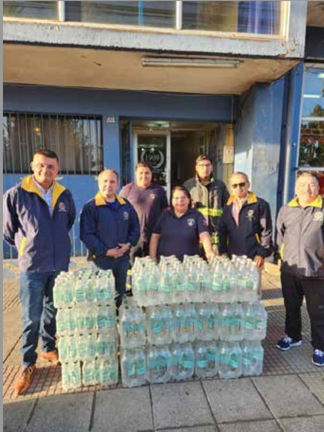
RC Nueva Imperial