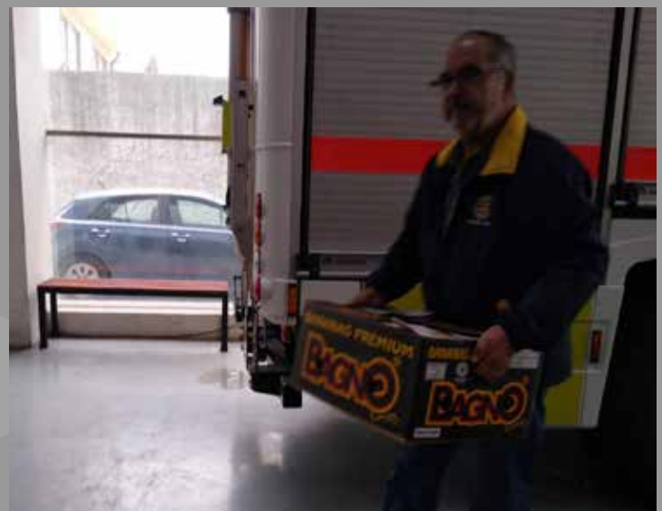
RC Concepción Norte