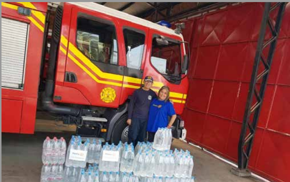
RC Talcahuano Sur