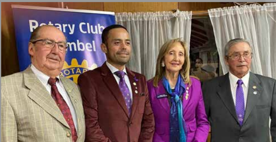
Investidura de socios Paul Harris.