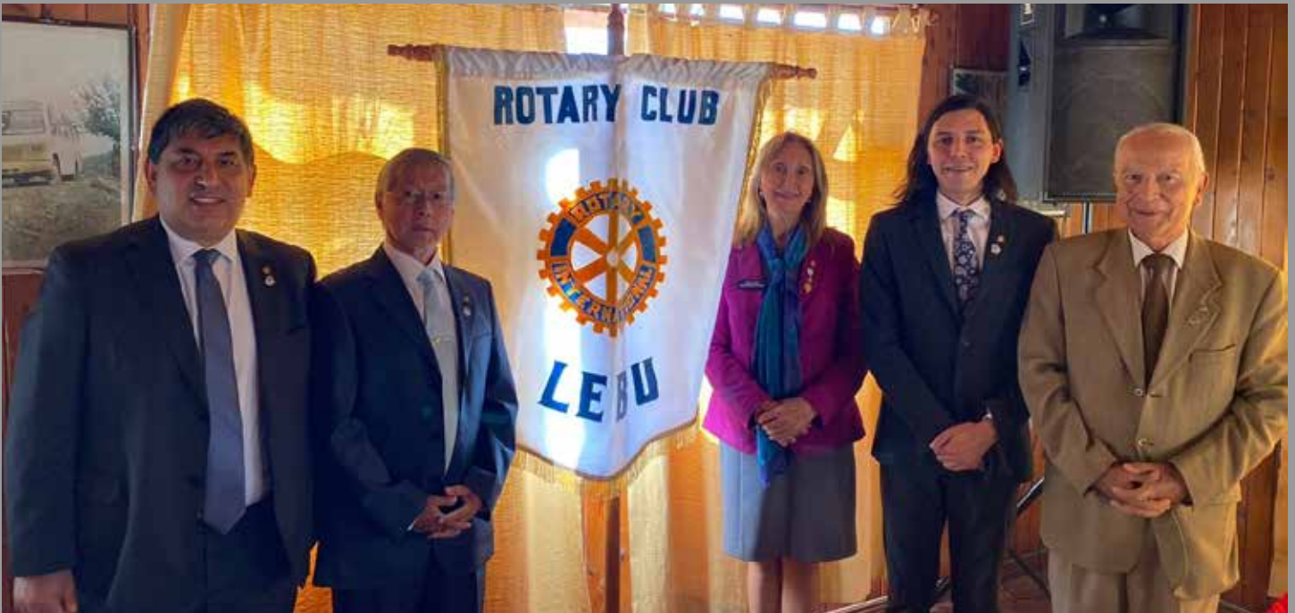
Directiva RC Lebu.