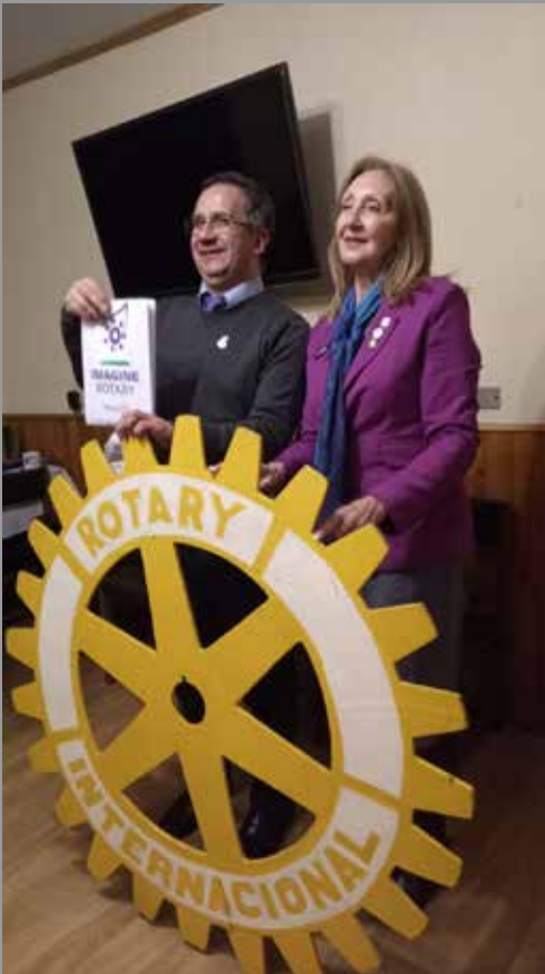
RC Puerto Aysén