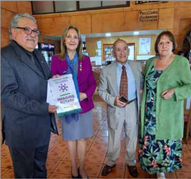
RC Los Álamos