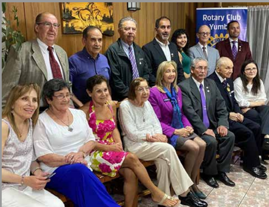
RC Yumbel, Comité de Damas