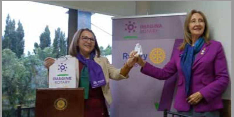
Presidenta RC Coyhaique Patagonia junto a la GD.