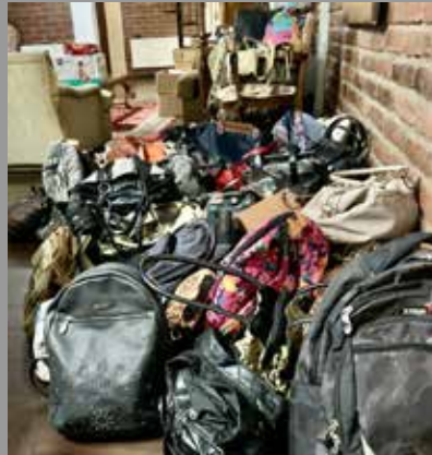
RC Gonzalo Arteche Los Ángeles