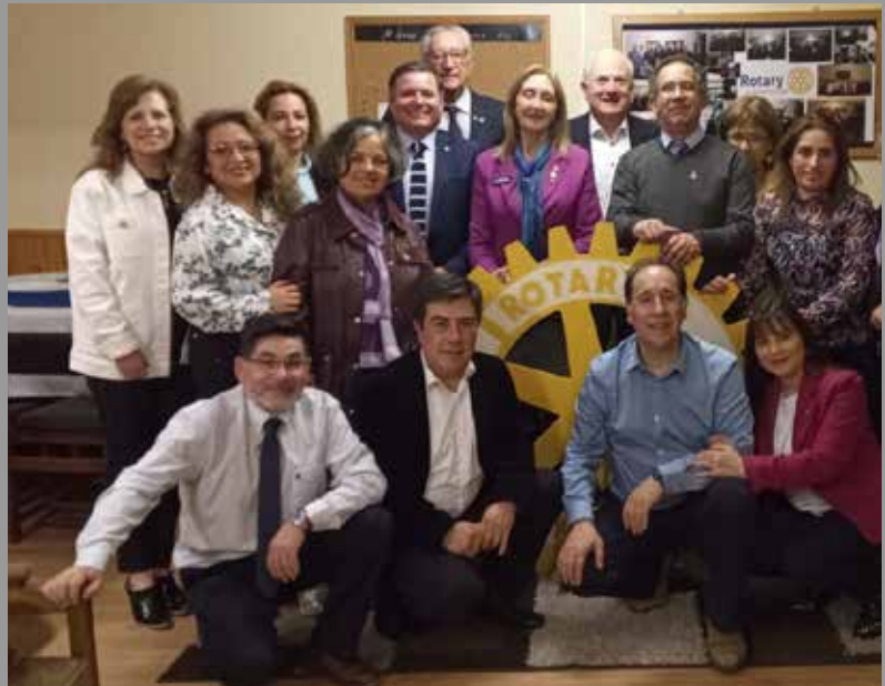
RC Puerto Aysén, Comité de Damas y Asistente de GD.