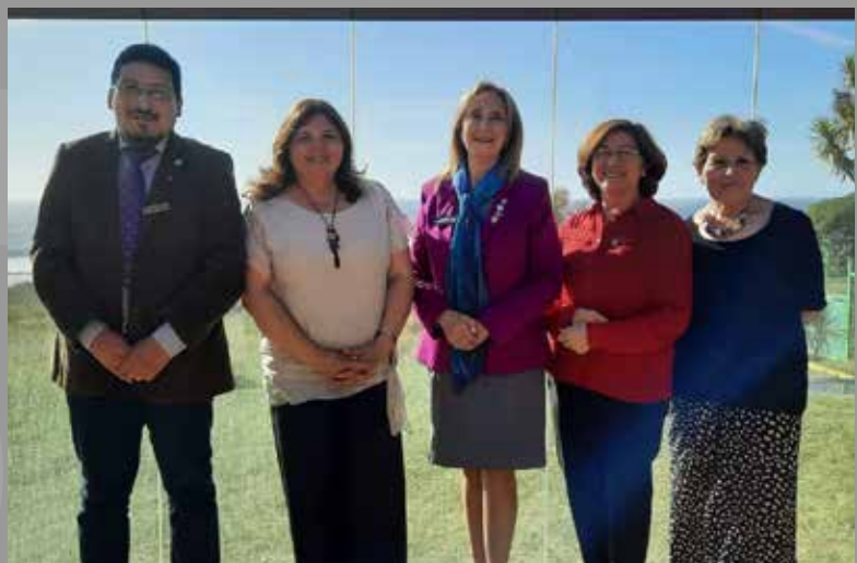
Comite de Damas RC Lebu y Asistente de la GD Zona 7