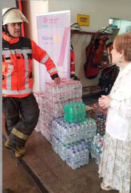
RC Las Águilas Temuco