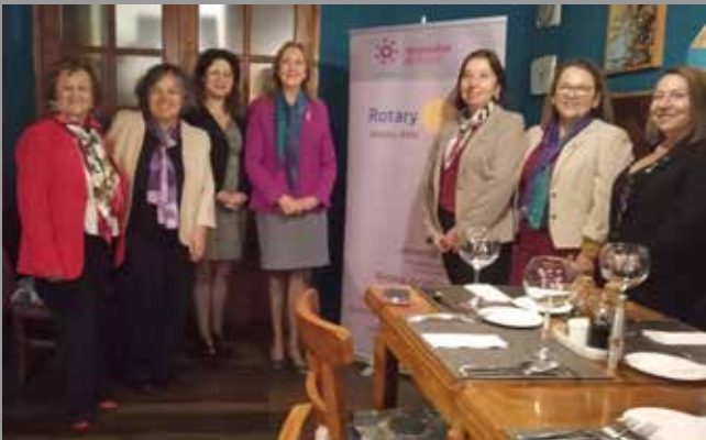
RC Coyhaique Patagonia