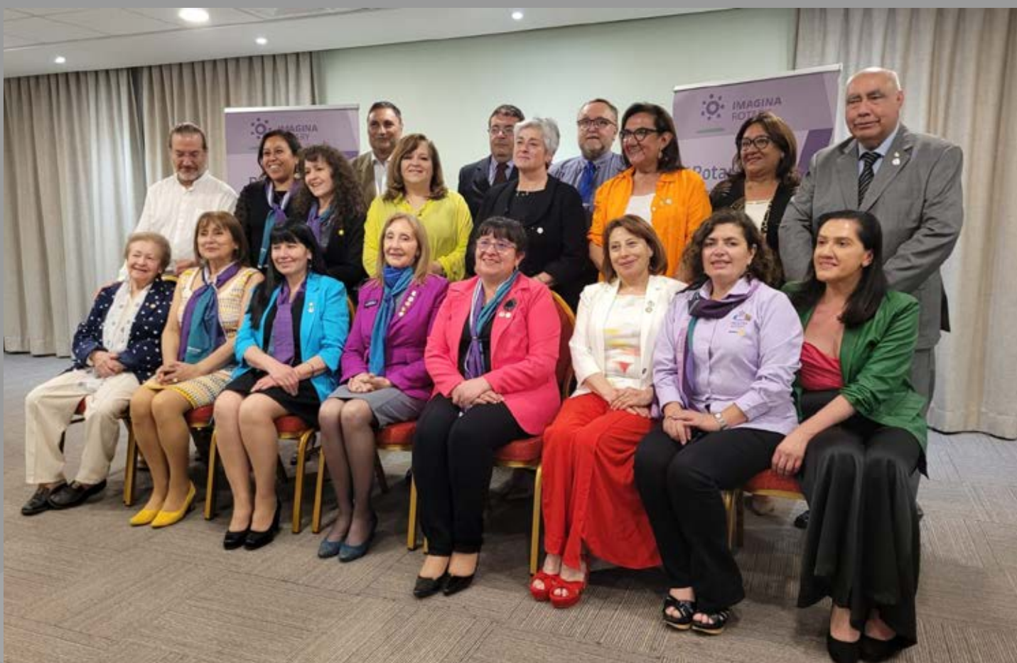
Reunión conjunta RC Castro y Castro Alihuen