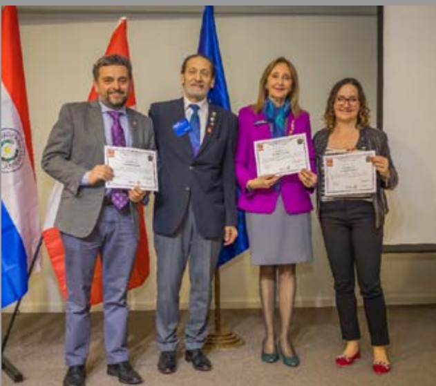
Entrega de Certificados Sociedad Polio Plus