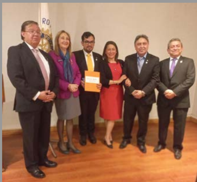
RC Concepción Incorpora nuevos socios