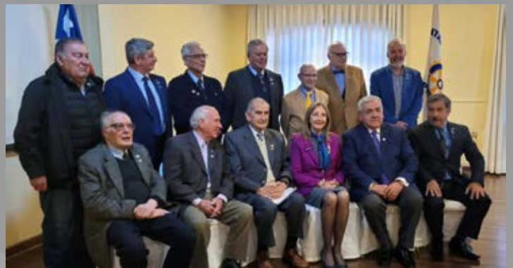
Visita Gobernadora a RC Puerto Montt