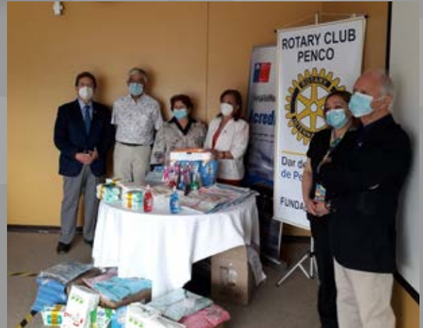
RC Penco en acción