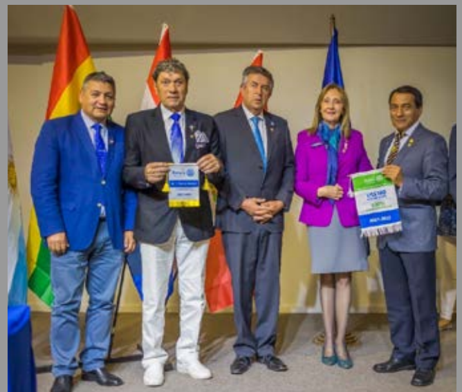
Entrega de Reconocimiento LFR periodo 21/22 RC Santa María de Los Angeles