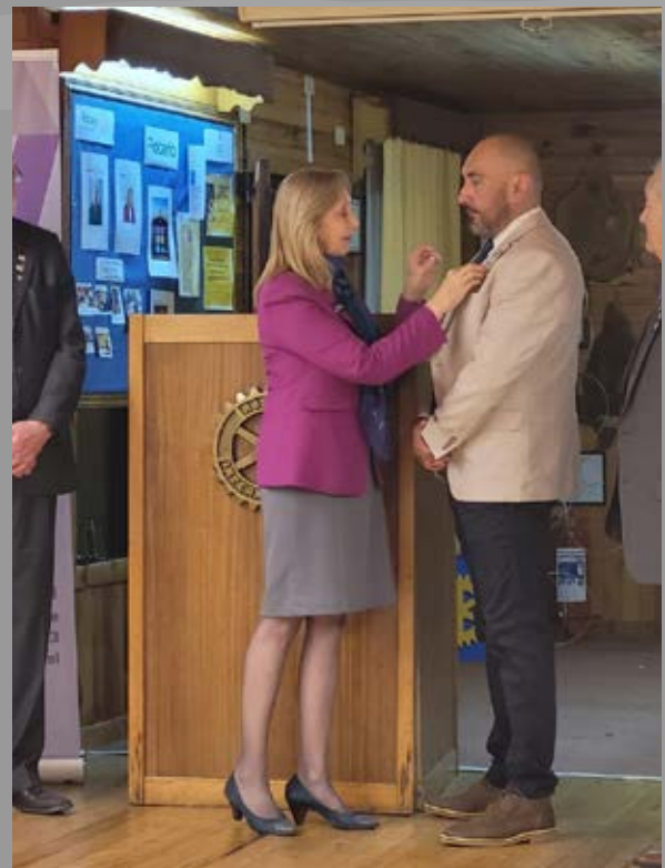
Investidura de nuevos socios RC Del Lago