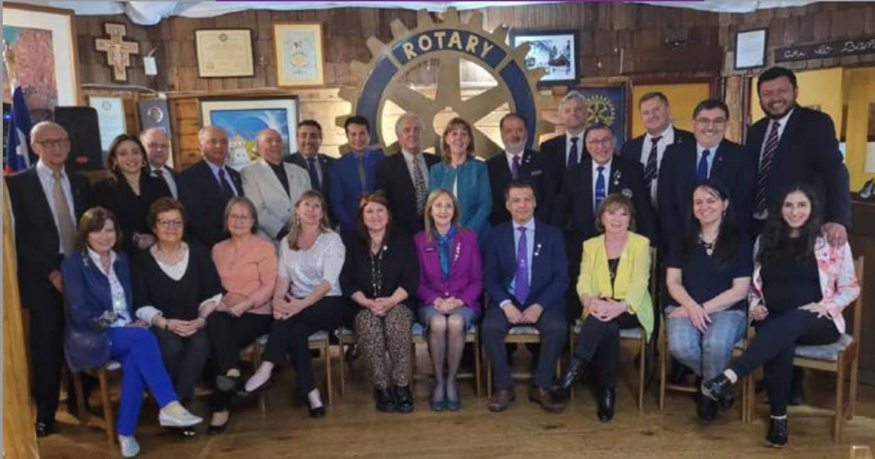
Visita GD a Rotary Club Puerto Varas y a Comité de Damas.