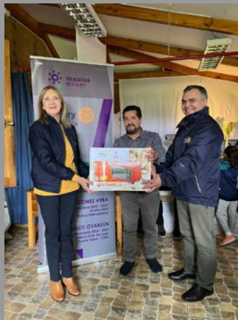
Junto al Presidente de RC Del Lago en entrega de donación del Club a escuela José Werner