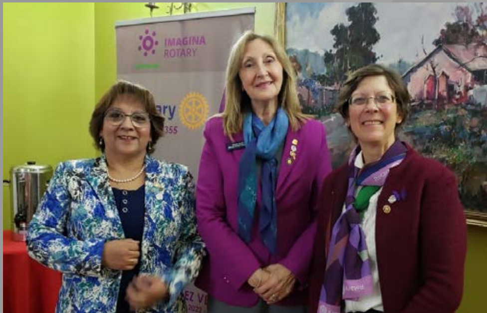
Entrega de Paul Harris PH8 en visita a RC Marta Colvin Chillán Viejo