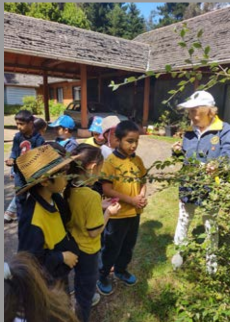
Los niños disfrutando del medio ambiente en RC Las Águilas Temuco