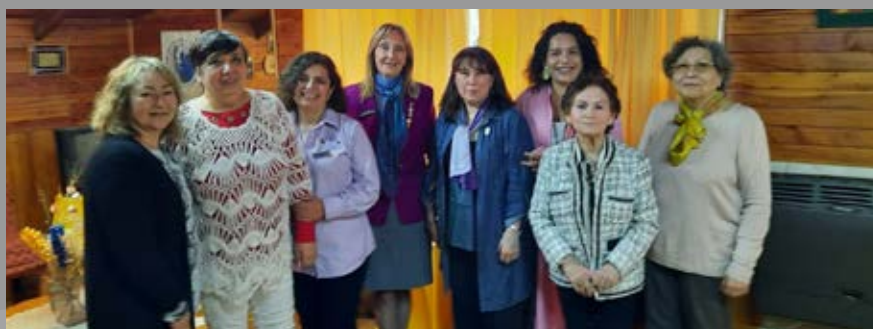
Reunion con Comité de Damas de RC Ancud.