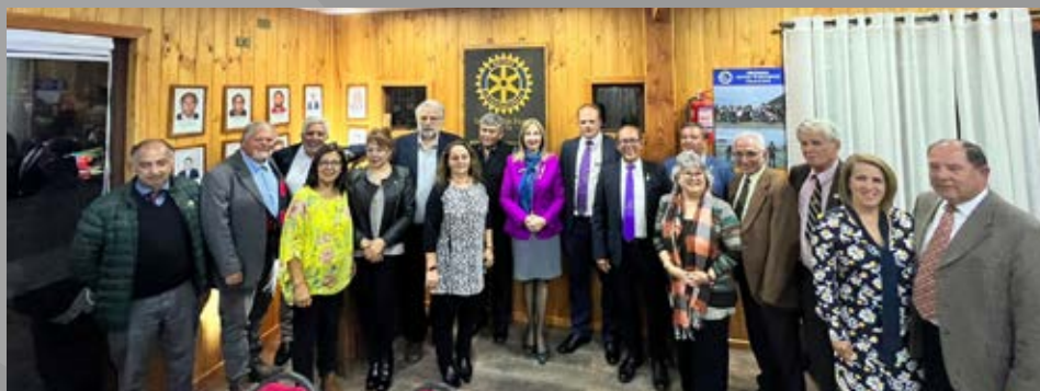
Visita GD a RC Villarrica y Villarrica Lafquen