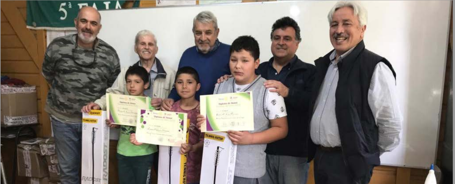
Rotary Club de Gorbea en Semana del Niño