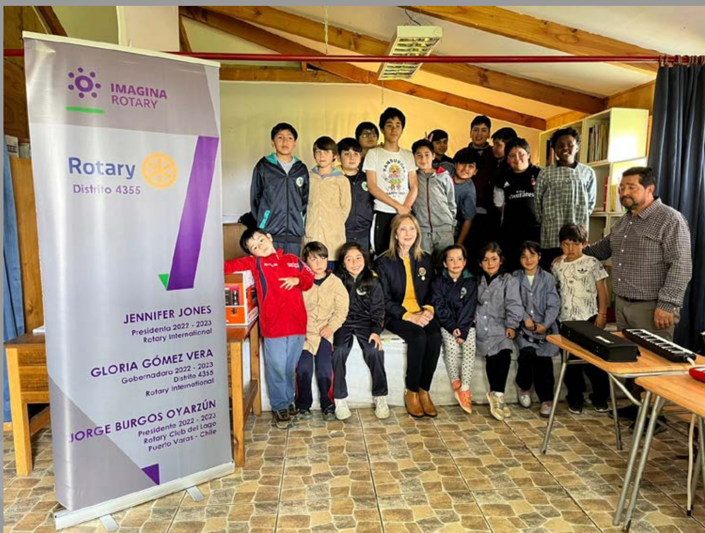
En visita a Escuela Joé Werner de Puerto Varas, junto a profesor, niños y niñas de cursos combinados.