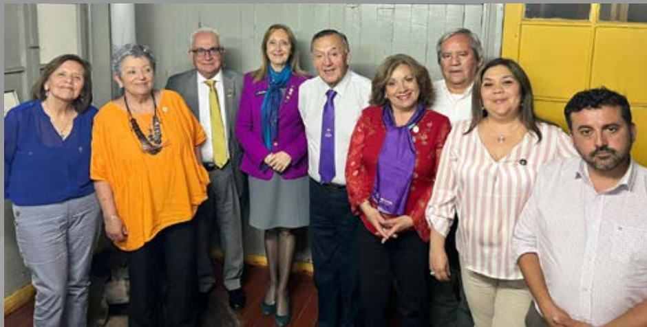
GD junto a Directiva de RC Loncoche y de Comité de Damas