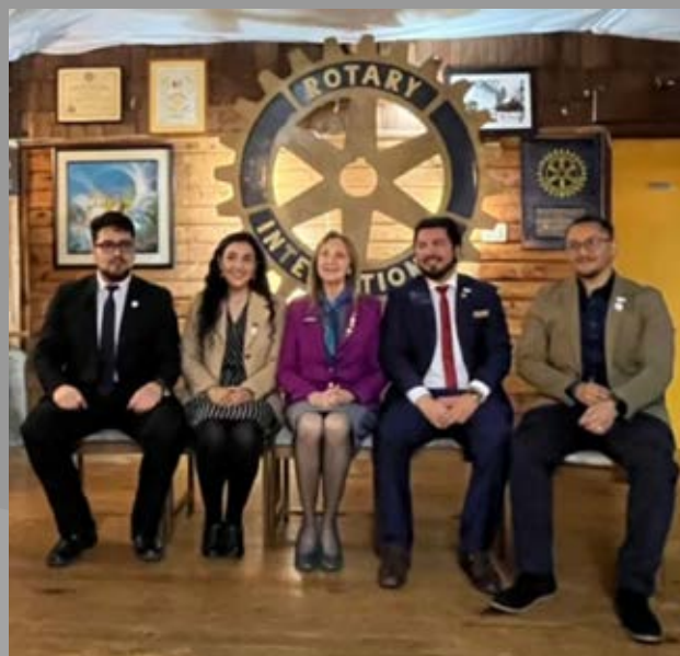
Rotaract Del Lago en visita GD