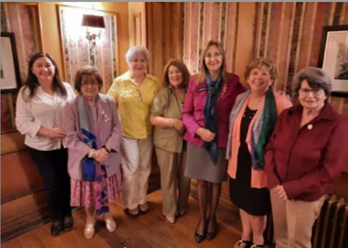
En reunión con Comité de Damas de RC Temuco Norte.