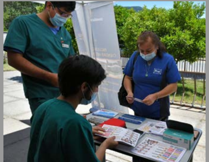
Rotaractianos junto a socios RC Chillán en operativo médico-Social