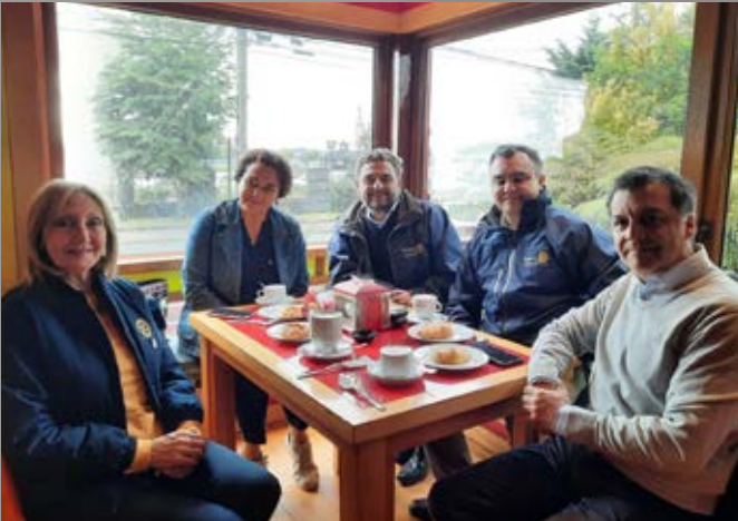
Gobernadora junto a GN y Presidentes RC Puerto Varas y Del Lago en entrevista Diario.