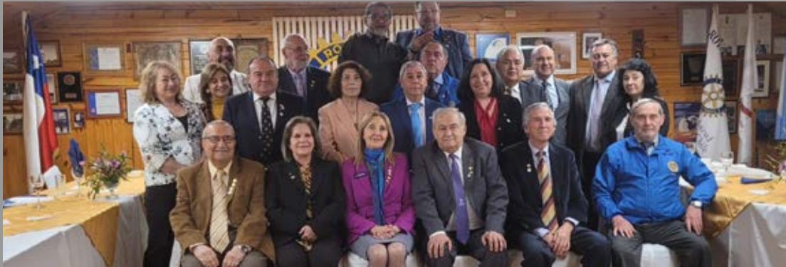
En sede de RC Ancud en visita a RC Ancud y Ancud Pudeto