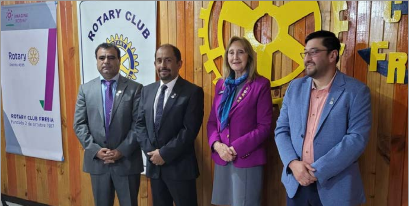
Incorporación de Nuevos Socios RC de Fresia