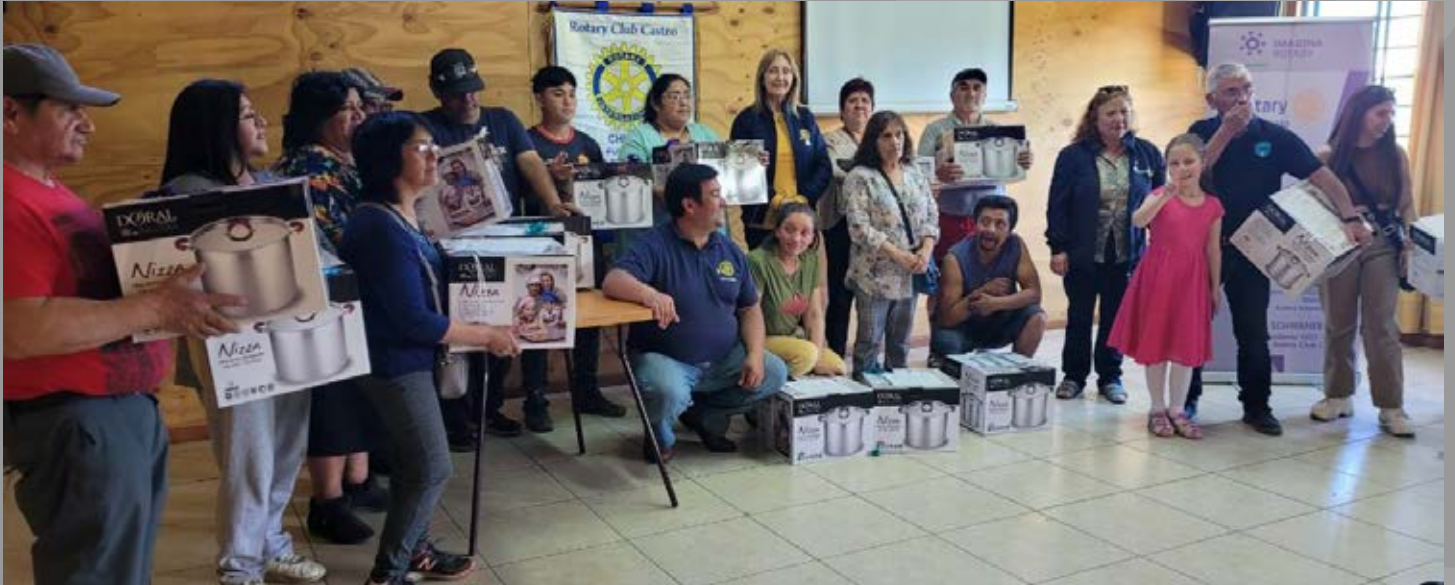
Junto a AG y socios de RC Castro entregando a Junta de vecinos afectados por el incendio implementos de cocina