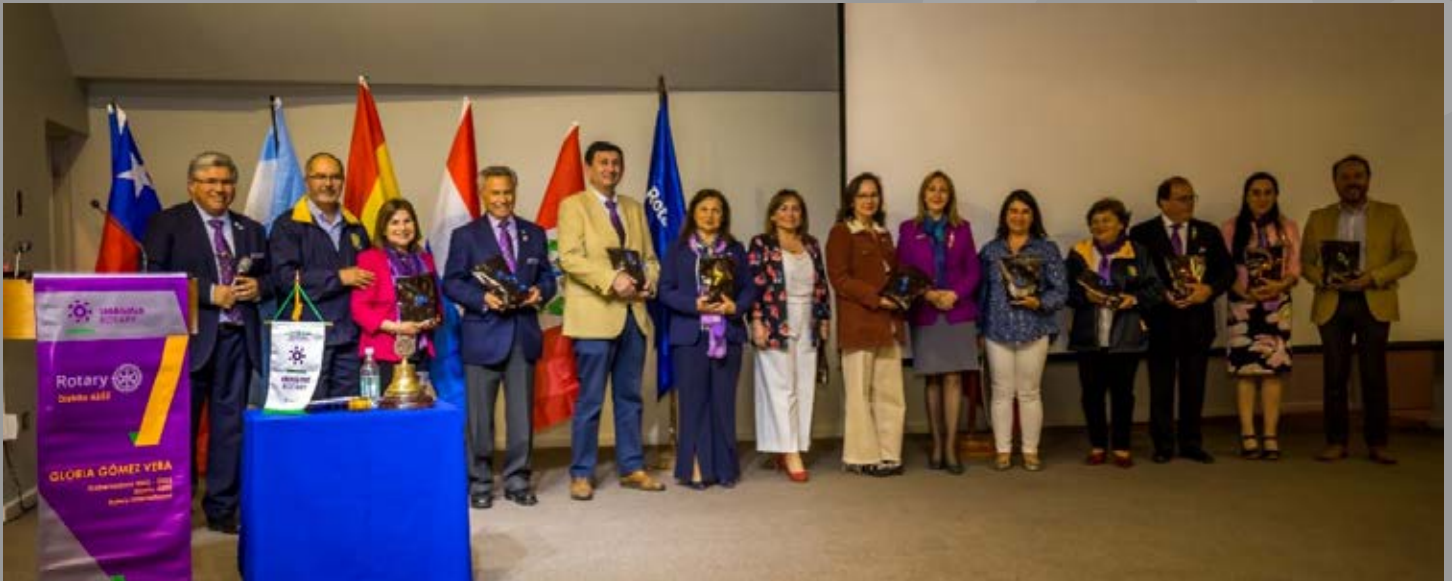
Equipo de trabajo Seminario Coordinaciones