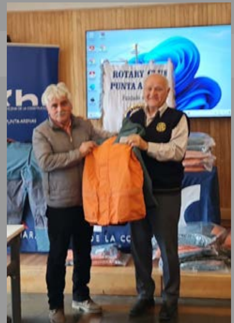
RC de Punta Arenas en acción