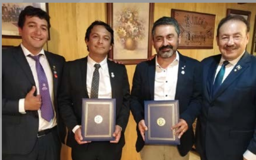
Incorporación de Socios a RC Los Ángeles.