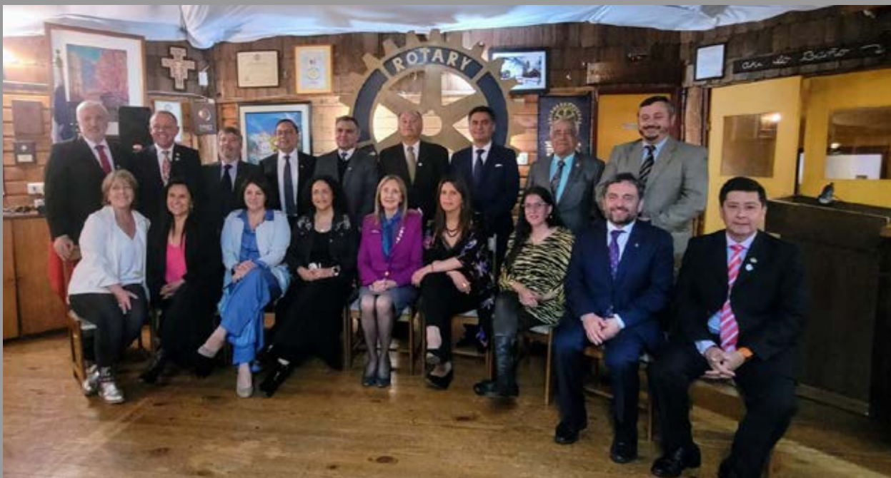
En visita oficial a Rotary Club Del Lago.