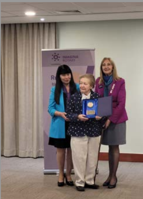
Junto a la Presidenta de RC Castro Alihuen entregando reconocimiento a Socia fundadora