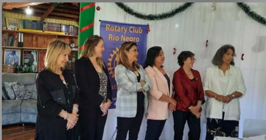
Incorporación de socias RC Río Negro.