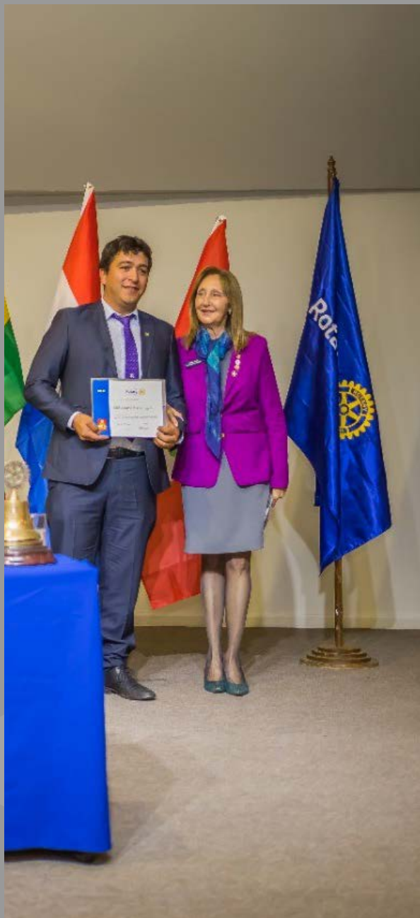
Entrega de Reconocimiento de LFR a RC Los Ángeles