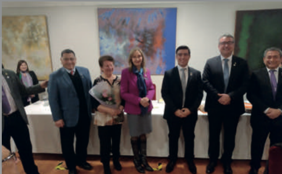
Ingreso de Socia y Socios RC Concepción Norte y Concepción.