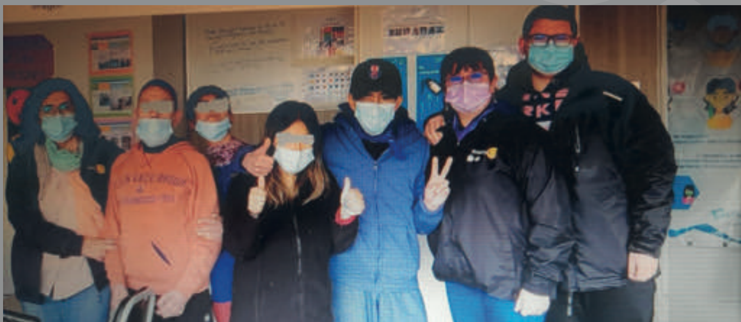
Entrega de carteras con artículos personales a 11 mujeres de Coanil.