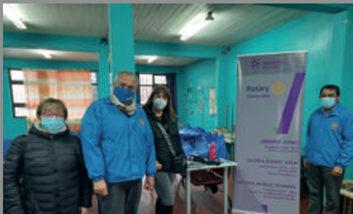
Rotary Club Santa María de Los Ángeles acude en apoyo de personas en albergue Municipal.