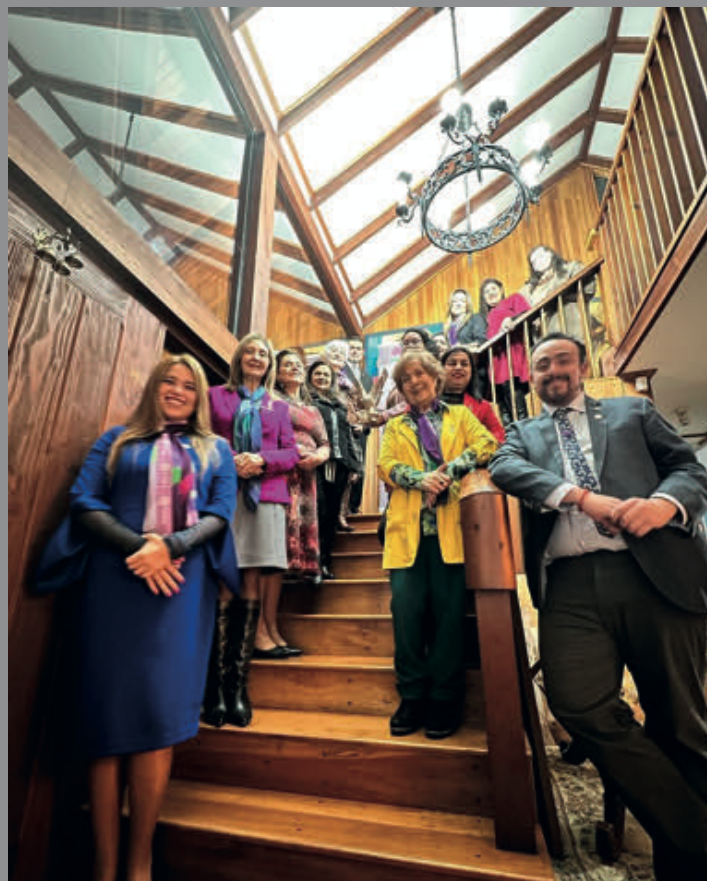
Visita GD Rotary Club Las Águilas Temuco.