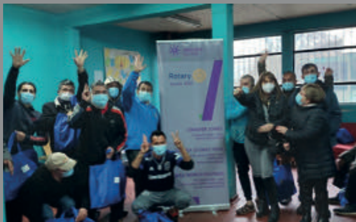
El apoyo realizado por el club consistió en la entrega de ropa y artículos de aseo para 20 hombres albergados en dicho recinto.