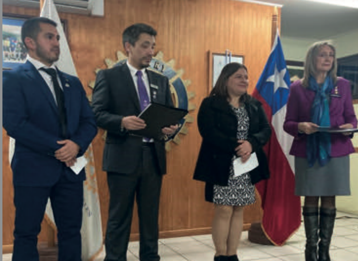
Ingreso Socia y Socio RC Los Ángeles Cordillera.