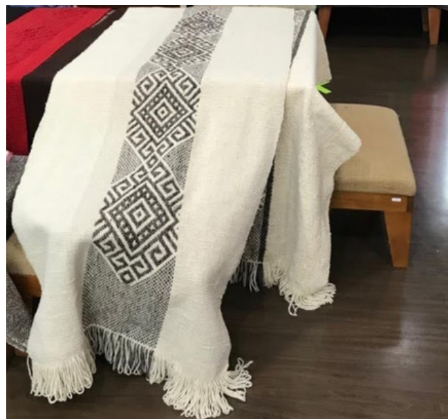
Telar Mapuche - Herminda Millanao