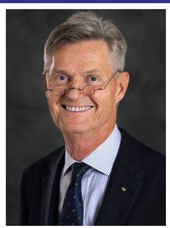
HOLGER KNAACK Presidente 2020-21

Al hacer un balance del año 2020, reflexiono sobre cómo han cambiado nuestras vidas. Para muchos de nosotros, la pandemia mundial de COVID-19 trajo dolor y pérdida. Y para casi todos, nuestra vida diaria, el tiempo en familia y el trabajo también cambiaron este año. Pero hemos llegado al final de este difícil año, no por cuenta propia, sino acercándonos entre nosotros, como siempre lo hacemos en Rotary. Con cada año que pasa, me siento más orgulloso de nuestra organización.