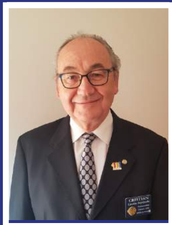
CRISTIÁN A. SEPÚLVEDA SHULTZ Gobernador 2020-21