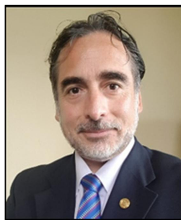
Boris (2018 – 2019)