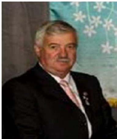
Ítalo (2012 – 2013)

Cerramos esta última edición con una galería de los Ex Gobernadores de nuestro Distrito