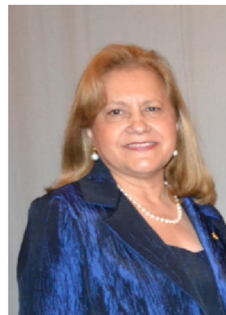
Maggie (2014 – 2015)