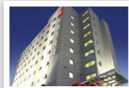
Ibis Asunción Hotel de 3 estrellas Avenida Aviadores del Chaco, Asunción A 120 metros del Hotel Sede

Accede a precios especiales de los siguientes hoteles contratándolos desde la web del Instituto: