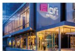
Aloft Asunción Hotel 4 estrellas Avenida Aviadores del Chaco, Asunción A 400 metros del Hotel Sede