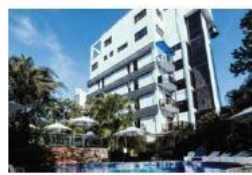
Los Alpes Santa Teresa Hotel 4 estrellas Av. Sta. Teresa, Asunción, A 1.000 metros del Hotel Sede

Accede a precios especiales de los siguientes hoteles contratándolos desde la web del Instituto: