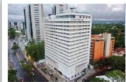
Dazzler by Wyndham Asunción Hotel de 4 estrellas Avenida Aviadores del Chaco, Asunción A 350 metros del Hotel Sede