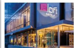
Aloft Asunción Hotel 4 estrellas Avenida Aviadores del Chaco, Asunción A 400 metros del Hotel Sede