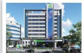
Hotel Holiday Inn Express Hotel de 3 estrellas Avenida Aviadores del Chaco, Asunción A 850 metros del Hotel Sede