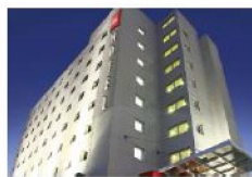
Ibis Asunción Hotel de 3 estrellas Avenida Aviadores del Chaco, Asunción A 120 metros del Hotel Sede

Accede a precios especiales de los siguientes hoteles contratándolos desde la web del Instituto: