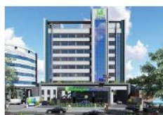
Hotel Holiday Inn Express Hotel de 3 estrellas Avenida Aviadores del Chaco, Asunción A 850 metros del Hotel Sede