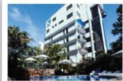
Los Alpes Santa Teresa Hotel 4 estrellas Av. Sta. Teresa, Asunción, A 1.000 metros del Hotel Sede