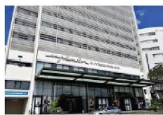
Esplendor by Wyndham Hotel 4 estrellas Av. Avenida Aviadores del Chaco, Asunción A 650 metros del Hotel Sede