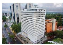
Dazzler by Wyndham Asunción Hotel de 4 estrellas Avenida Aviadores del Chaco, Asunción A 350 metros del Hotel Sede