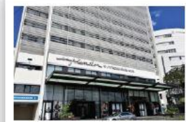
Esplendor by Wyndham Hotel 4 estrellas Av. Avenida Aviadores del Chaco, Asunción A 650 metros del Hotel Sede