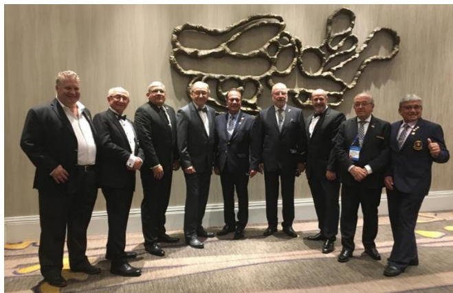
Gobernadores electos para la zona 23B