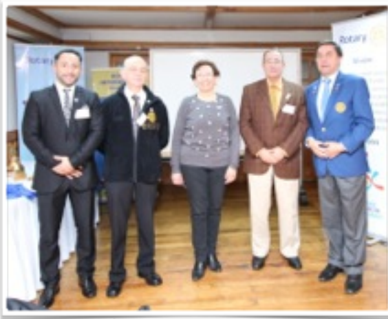
PETS Punta Arenas