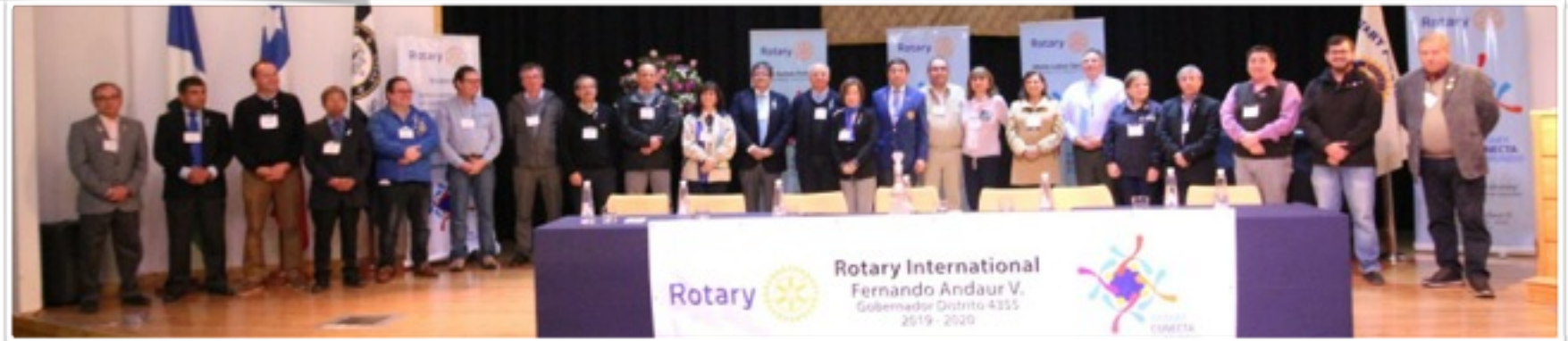
PETS Puerto Montt