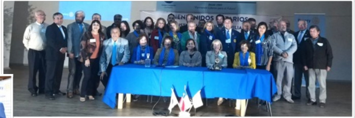
PETS Los Angeles

Investidura de los Presidentes período 2019-2020, en PETS y Asamblea en Los Angeles(6 de abril), Punta Arenas (12 de abril) y Puerto Montt (27 de abril)