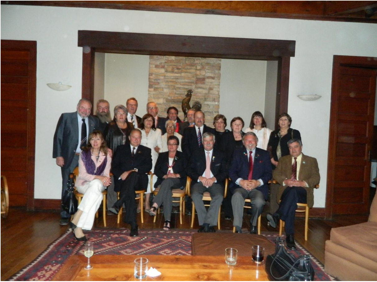
Rotary Club Punta Arenas