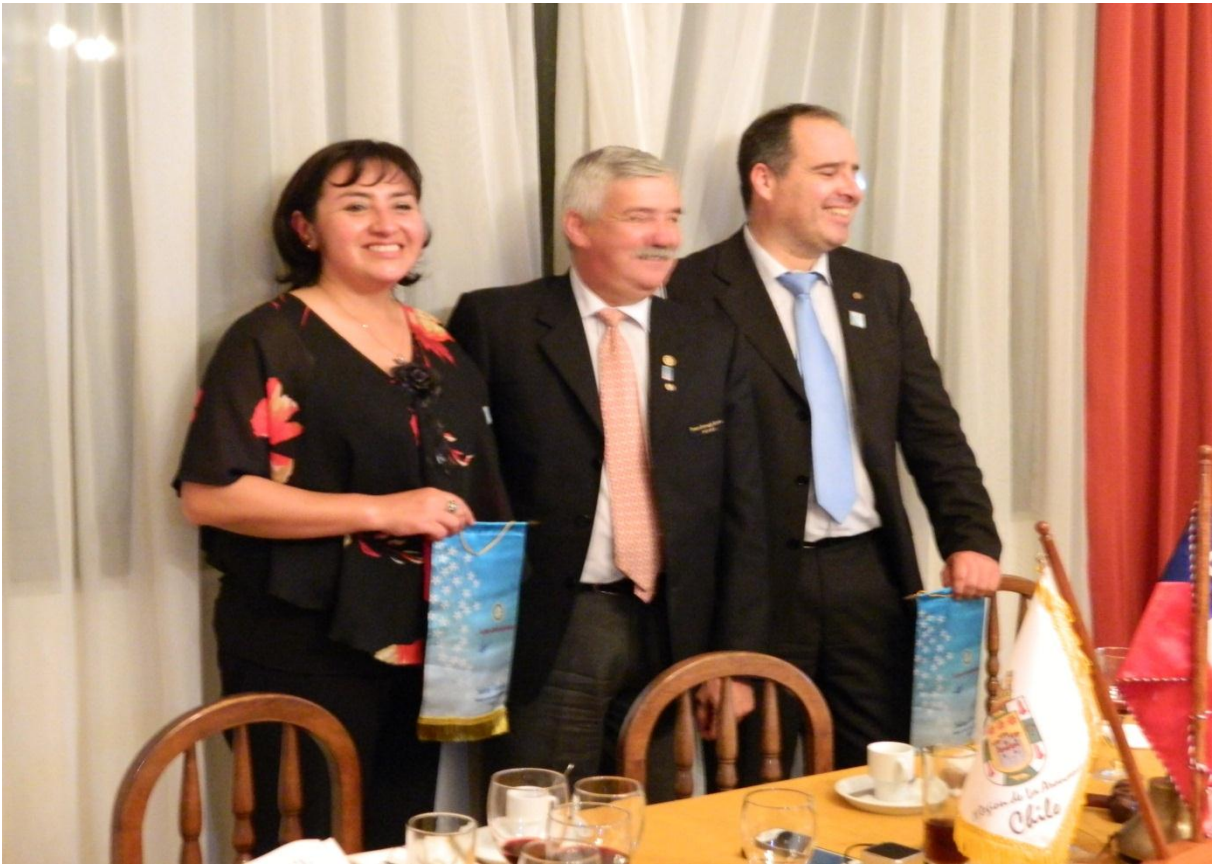
Rotary Club Coyhaique Patagonia