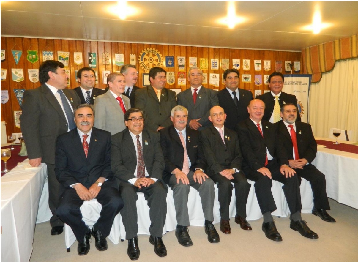
Rotary Club Puerto Octay