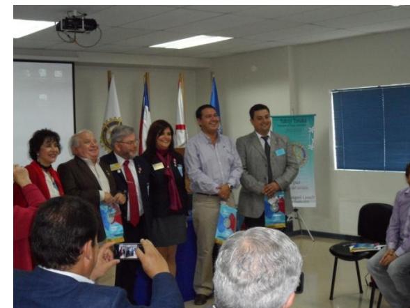
Asistentes de Gobernador